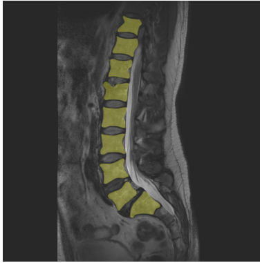
Abbildung 4.1: Segmentierung einer Wirbelsäule in einer MagnetResonanz (MR) Aufnahme.

Die Erfassung komplexer Umgebungen, z.B. für die Steuerung autonomer Systeme oder für die digitale Erfassung realer Objekte, ist der zentrale Schwerpunkt des Bereiches Maschinelles Sehen / Computer Vision . Derartige Systeme kommen beispielsweise in der Automobilindustrie (Fahrerassistenzsysteme) oder in der Medizin (stereoskopische Endoskopie) zum Einsatz. Ein Spezialfall des Maschinellen Sehens ist die Erkennung menschlicher Gestik und Mimik für die Mensch-Maschine-Interaktion , welche z.B. die Voraussetzung für den sicheren Betrieb (teil-)autonomer Fahrzeuge oder Roboter ist.