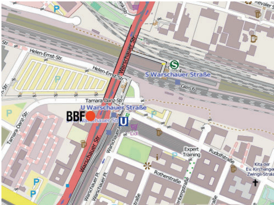
Karte erstellt mit OpenStreetMap, Open Database License (ODbL)