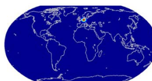
Lokale Basisfunktionen auf der Sphäre, konzentriert auf Siegen