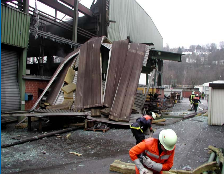
Kleinere Schadens- lagen