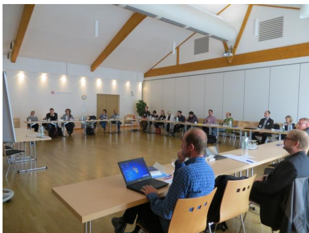
CoDec plenary meeting in Siegen

Międzynarodowa Konferencja miała miejsce w Siegen w dniach 15-18 października 2014. Eksperti z krajów partnerskich, którzy zajmują się tematem kolonializmu i dekolonizacji, omówili najnowsze kwestie pojawiające się w badaniach, zaprezentowali najświeższe źródła, o których się dyskutuje. Podczas warsztatów zaprezentowano i omówiono sugestie dotyczące nauczania, które po opracowaniu będą elementem modułów lekcyjnych (w wersji papierowej i on-line). Perspektywa europejska jest głównym kryterium przy doborze źródeł zaprezentowanych przez naukowców, ma ona stanowić element umożliwiający nauczycielom z całej Europy ich wykorzystanie, jako uniwersalnych materiałów do omawiania „wspólnych szlaków historycznych” czy wspólnej kolonialnej przeszłości. Opracowane moduły nawiązują do głównych tematów projektu: Kolonializm zamorski, kolonializm wewnątrz europejski, dekolonizacja i polityka pamięci.