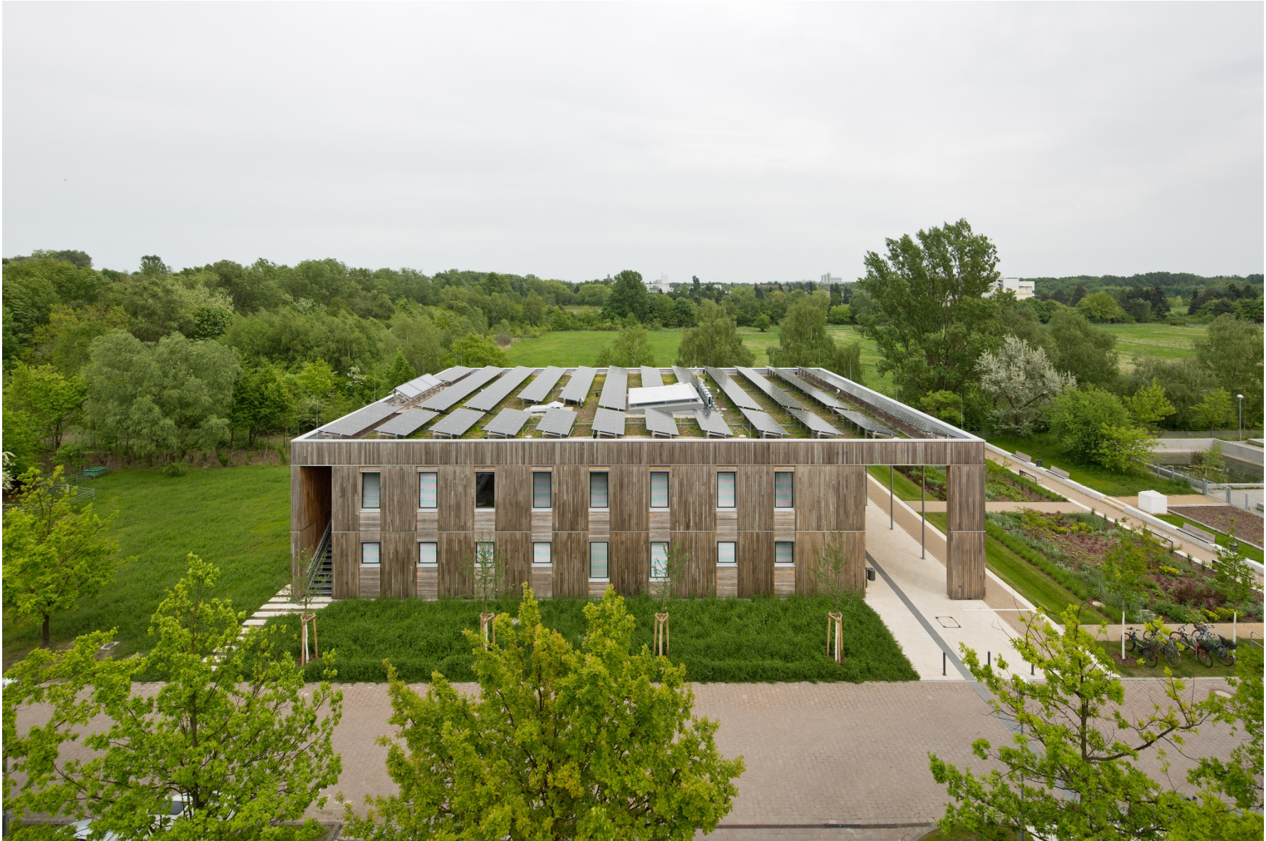
Projekt Umweltbundesamt Haus 2019 – erstes Effizienzhaus Plus des Bundes