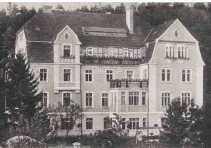
Erster Sitz des ‚Entjudungsinstituts‘, Bornstraße 11

14.45 - 15.45 Völkische Weltanschauung, Religiosität, Religionskonzepte und Religionsgemeinschaften in der langen Jahrhundertwende Uwe Puschner (Berlin)