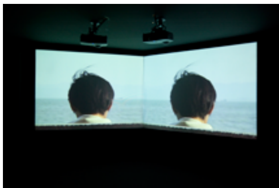
Oracle , 2007 (Doppelprojektion, 12 Min.)