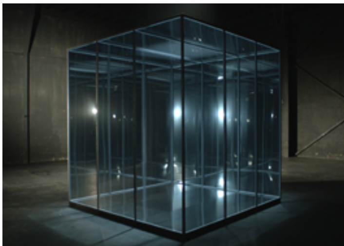
The Lost Object, 2016 (Video, 12.30 Min.)