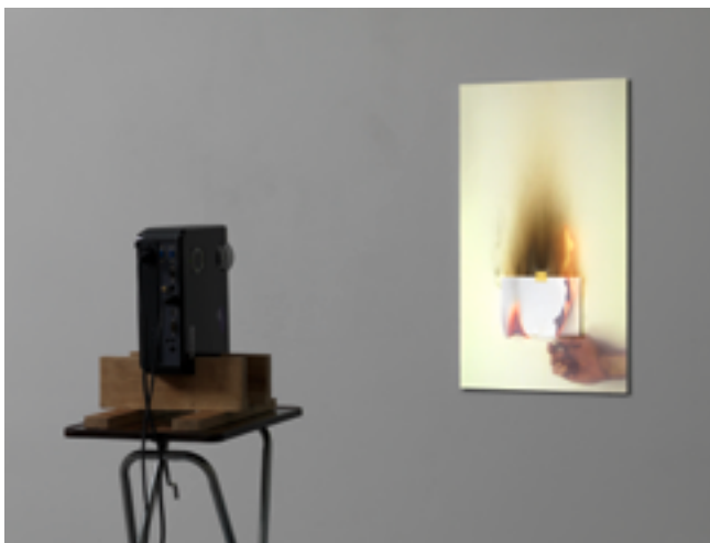
The Obstacle is the Path I, 2010 (Videoinstallation, 23 Min.)