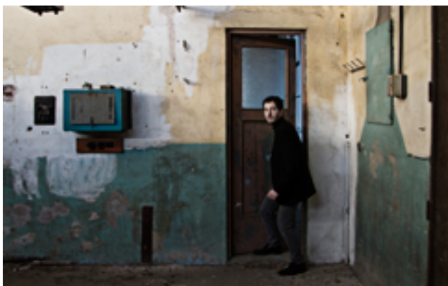
Pasajes, 2012 (Video, 12.30 Min.)