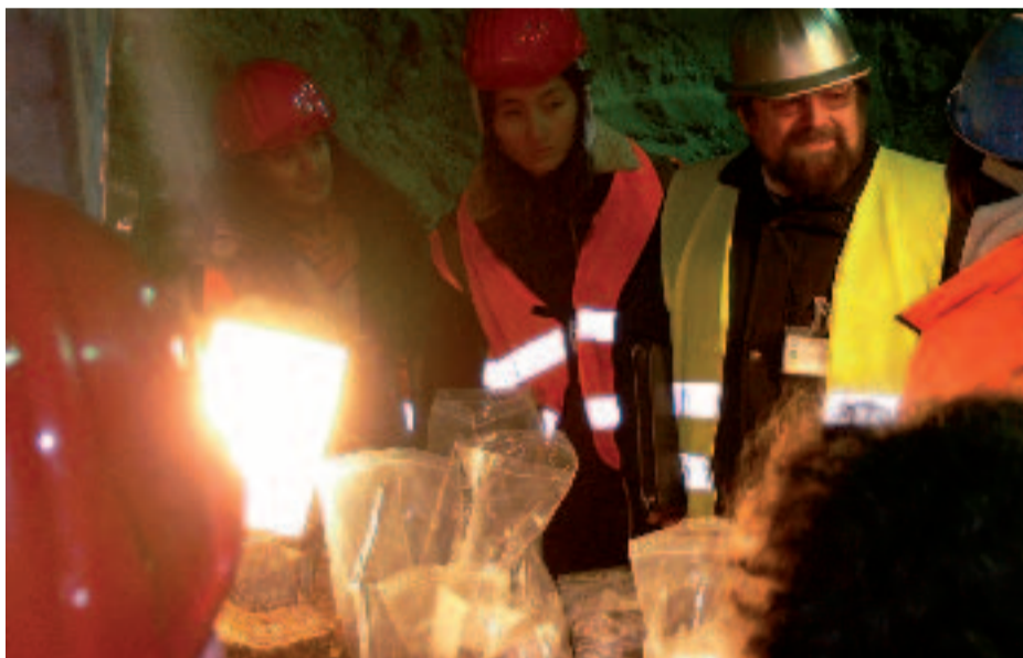
Archäologische Grabungen im Bereich der geplanten U-Bahn