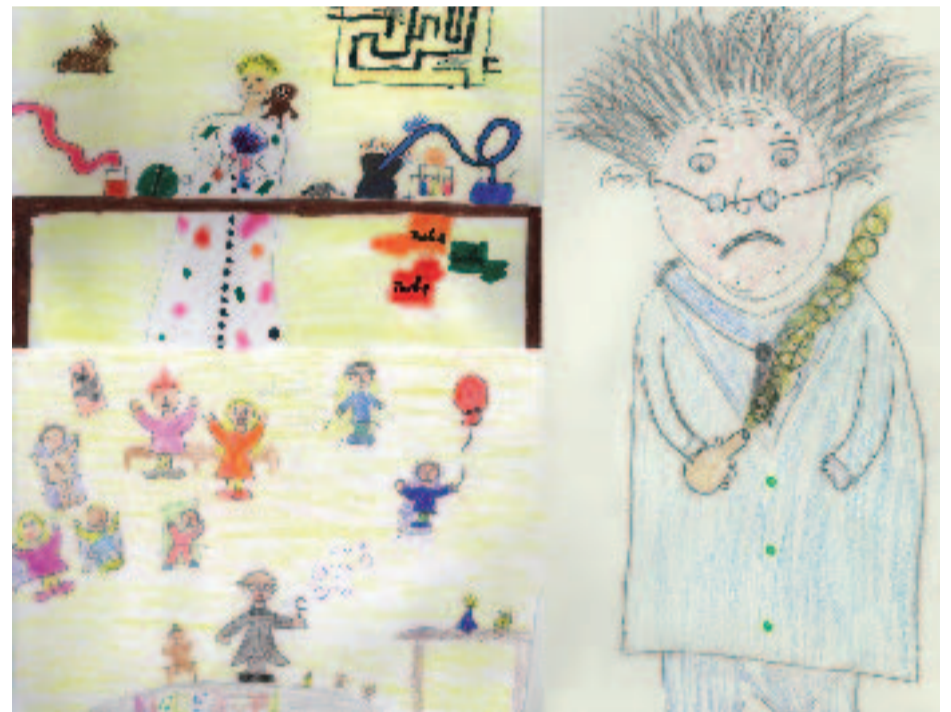
Über einen Malwettbewerb, den die Siegener Zeitung initiierte, konnten die Kinder sowohl ihren Vorstellungen von einer Universität Ausdruck geben als selber auch Themenvorschläge einschicken.