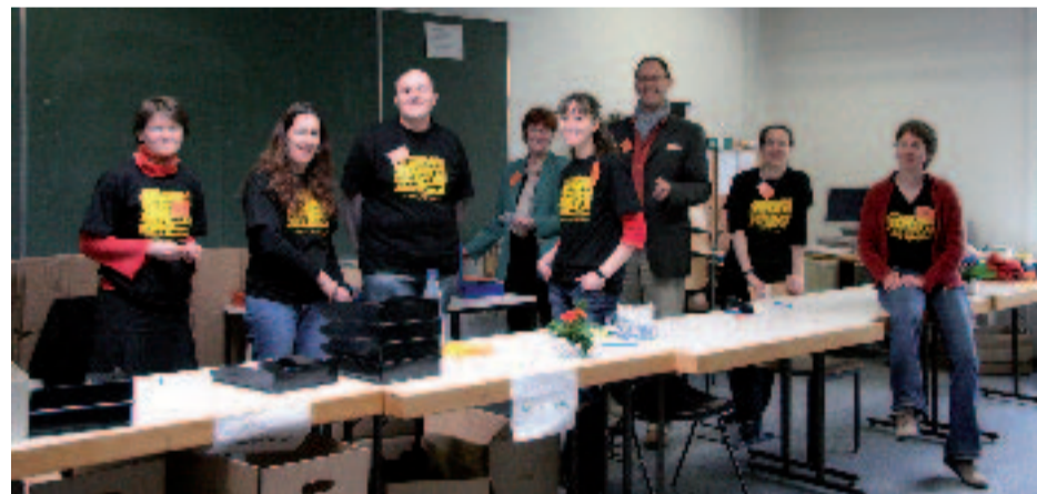
Das Team im Tagungsbüro

gen Sprachwissenschaftler zu finden, der ihre Sorge teilen möchte. Vielmehr besteht in der Fachwissenschaft weithin ein Konsens darüber, dass die europäischen Hochsprachen zwar – wie Sprachen im Allgemeinen – der regionalen, sozialen und fachlich-institutionellen Variation und Veränderung unterliegen, aber in der heutigen Konstellation in ihrem Bestand nicht gefährdet sind.