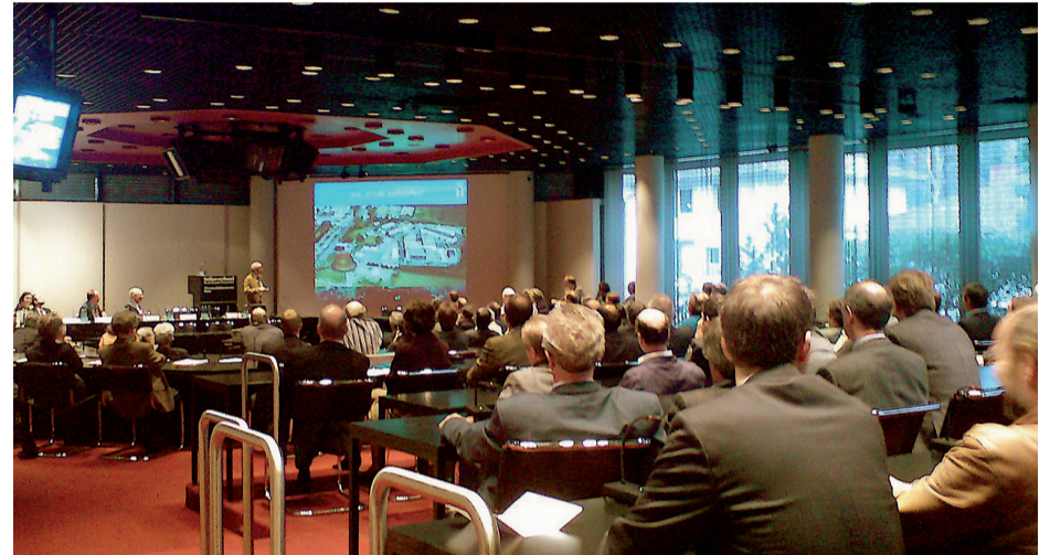
Blick in das Auditorium

mittels zwei zentraler Institutionen: Zum einen über die „Deutsche Forschungsgemeinschaft“ (DFG), zum anderen über das BMBF. Die Institutionen unterscheiden sich voneinander in Hinsicht auf die Art der von ihnen geförderten Forschungsvorhaben und in Hinsicht auf ihre Organisationsform. Während die DFG in erster Linie Forschungsprojekte auf regionaler Ebene mit verhältnismäßig kurzen Laufzeiten finanziert hat, konzentriert sich das BMBF auf die Förderung überregionaler Forschungsvorhaben, deren Realisierung lange Förderungs-Laufzeiten voraussetzen. Das BMBF hat nun neue