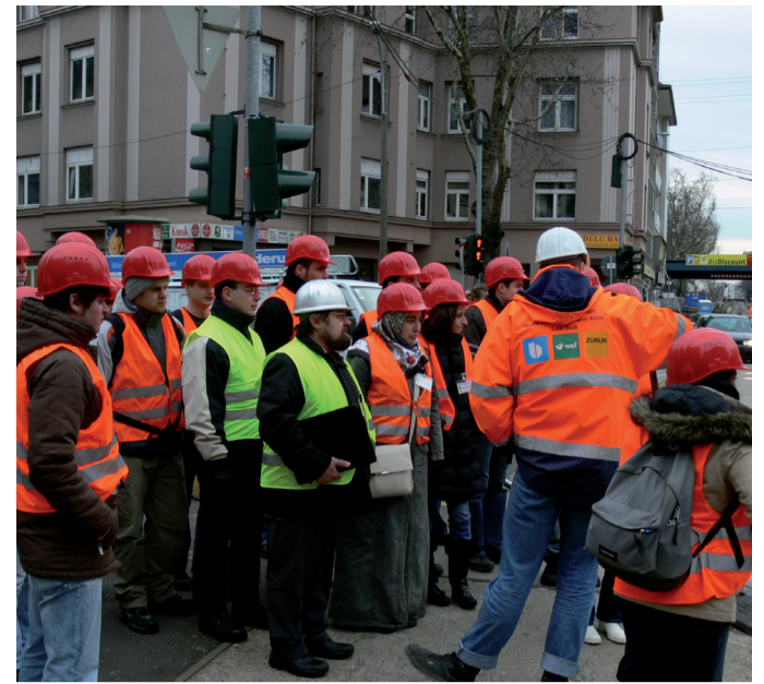
Während der oberirdischen Erläuterungen

Von besonderem Interesse waren die Baumaßnahmen der unterirdischen Haltestellen und Kreuzungspunkte. Hier erfuhren die Studierenden, dass nach der Umschließung der Baugruben durch Schlitzwände ein Voraushub vorgenommen wurde, anschließend werden die Baugruben provisorisch ‚abgedeckt‘ und