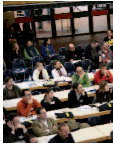
Ein interessiertes Publikum hört die Plenarvorträge im Audimax