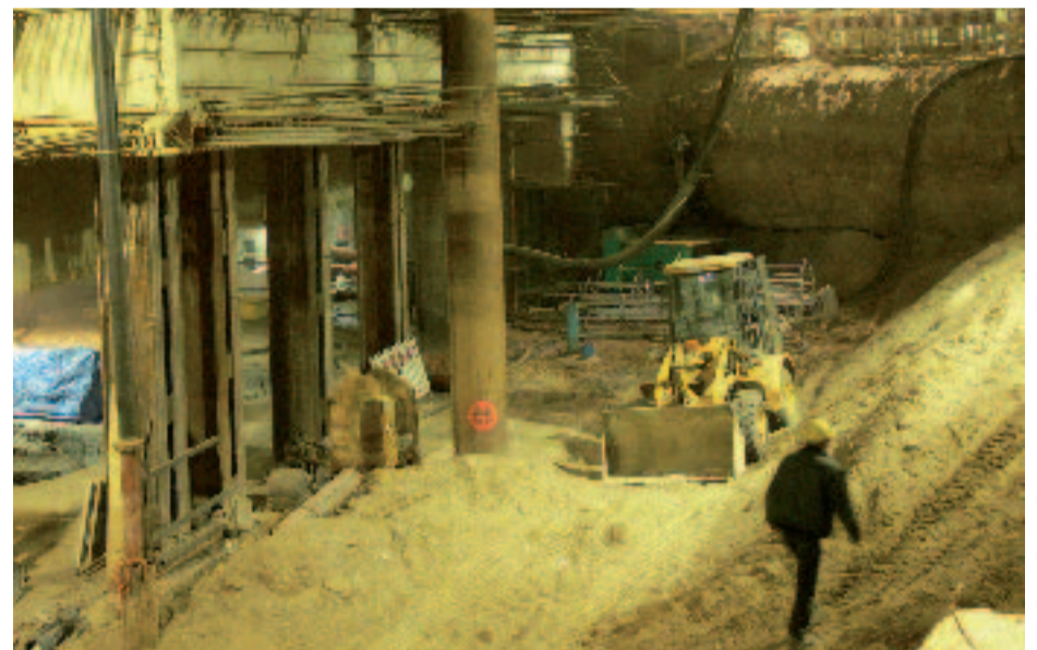
Beeindruckende Dimensionen im unterirdischen Bereich der geplanten Haltestellen

Einblick in das vielfältige Feld des Bauwesens, des Spezialtiefbaus, der Geotechnik und hier auch der Archäologie erhalten. Und wir möchten diese, immer wichtiger werdende, interdisziplinäre Zusammenarbeit auch schon im Studium darstellen und unseren Studierenden in Siegen zeigen, dass der Bauingenieur immer wieder neue Felder erschließen muss, die er al-