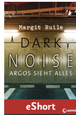
Dark Noise - Argos sieht alles